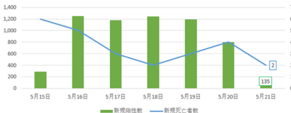
直近1週間のCOVID-19新規陽性数と新規死亡者数の推移

全国病床率は2%と人工呼吸器病床率1%になります。 死亡率は2020年3月頃の水準にまで落ち着いております。